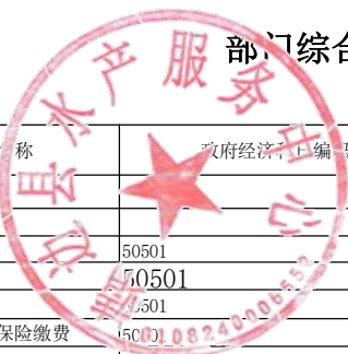
部门综合预算一般公共预算支出明细表(按支出经济分类科目)