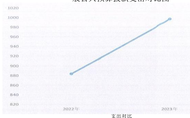
一般公共预算拨款支出对比图